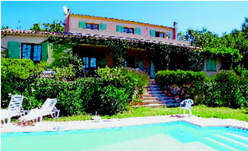
LA GARDE FREINET, CÔTE D'AZUR: Mitten im Nationalpark Massif des Maures gelegene Ferienvilla für acht Gäste. Mietpreis: ab ca. 1.798 € / Woche (Marion Kutschank).