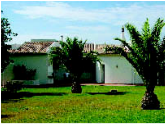
ESTOI, ALGARVE: Ferienvilla mit Blick auf das Meer, drei Schlafzimmern, zwei Bädern und Büro-raum. Kaufpreis: ca. 695.000 € (Three Fountains).