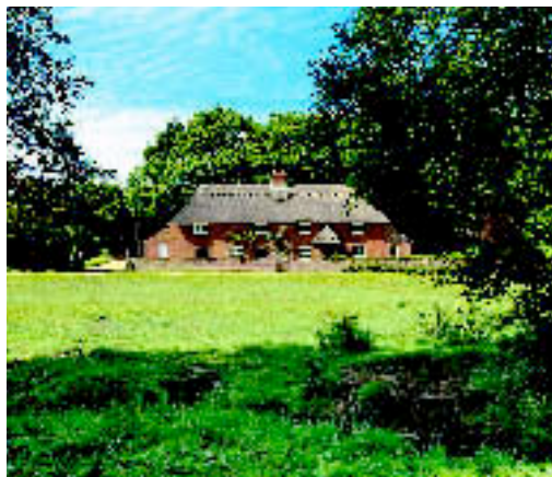
„THATCHED COTTAGE“, HAMPSHIRE: idyllisch gelegenes Ferienhaus für acht Gäste. Miete: ab ca. 1.340 € / Woche (Karin Pleischl).