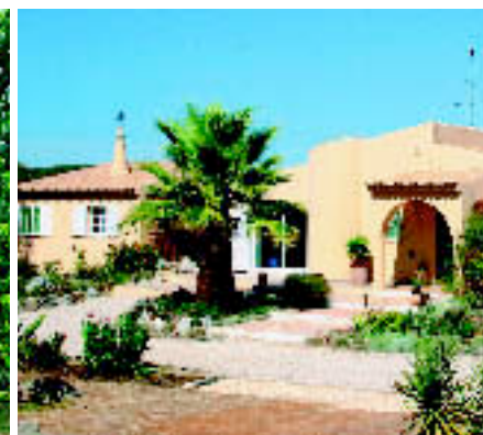
MONCARAPACHO, ALGARVE: Villa mit rund 7.600 qm Grundstück. Kaufpreis: ca. 390.000 € (Three Fountains).