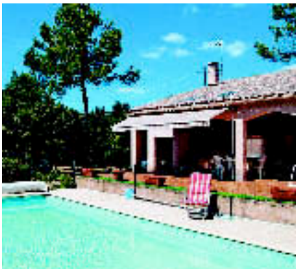
FLASSANS, PROVENCE: Ferienhaus mit Pool, für acht Personen. Miete: ab ca. 998 € / Woche (Marion Kutschank).