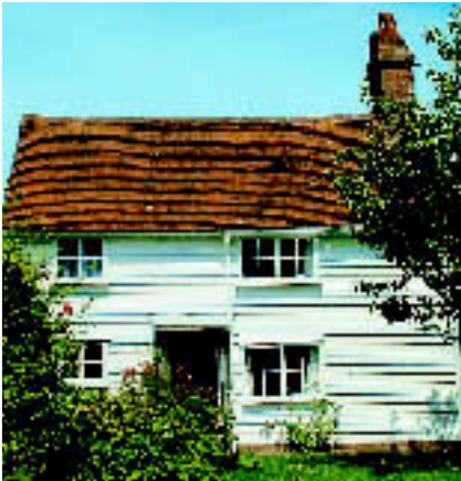
NORTHIAM, EAST SUSSEX: Cottage mit kleinem Backstein-Gartenhaus. Kaufpreis: ca. 390.000 € (Mayfair).