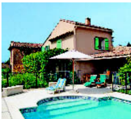
CARPENTRAS, PROVENCE: Ferien- villa für vier Gäste, mit Bergblick. Miete: ab ca. 865 € / Woche (Marion Kutschank).