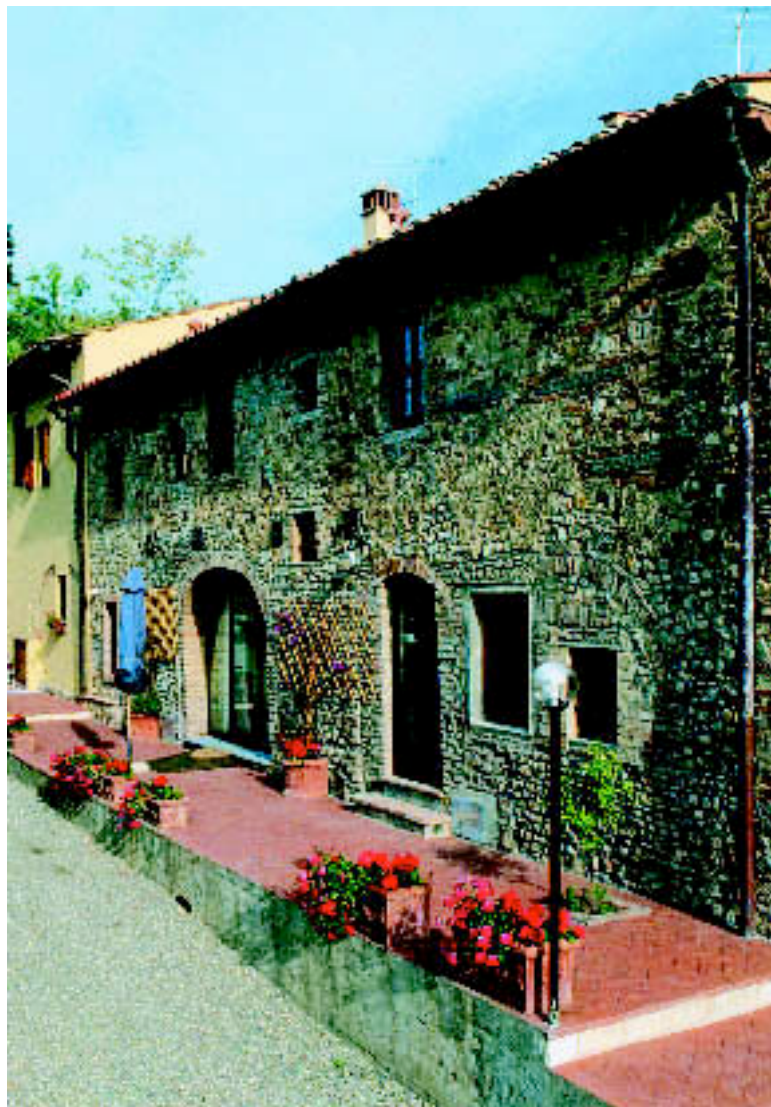
„LA VALLE“ MONTESPERTOLI, TOSKANA: Agriturismo auf einem bewirtschafteten Landgut. Die sieben Ferienwohnungen bieten je nach Größe Platz für zwei bis acht Gäste. Miete: ab ca. 680 € / Woche (Case in Italia).