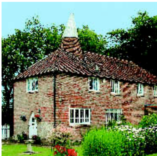
BECKLEY, EAST SUSSEX: denkmalgeschützter Bauernhof mit frei stehender Garage und Gartenhaus. Kaufpreis: ca. 700.000 € (Mayfair).