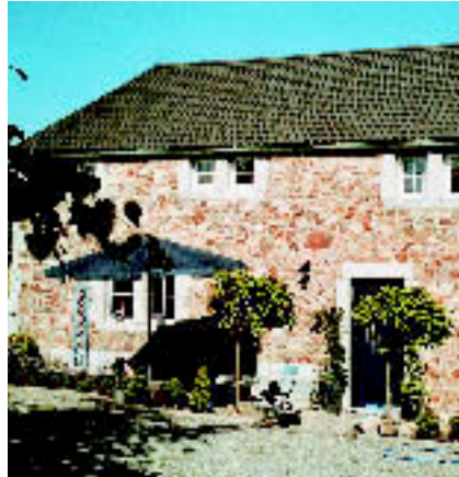
NÄHE SPA, BELGIEN: renovierter Bauernhof für sechs Gäste. Miete: ab ca. 450 € / Woche (La Fermette Bleue).