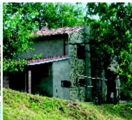
GROSSETO, TOSKANA: Rustico mit 1,85 Hektar Grund. Kaufpreis: ca. 285.000 € (Toscana Landhäuser).