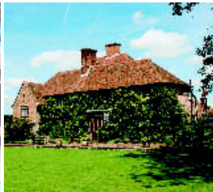
NÄHE ASHFORD, KENT: Herrenhaus mit ca. 1,5 Hektar Grundstück und Pool. Kaufpreis: ca. 1,14 Mio. € (Mayfair).